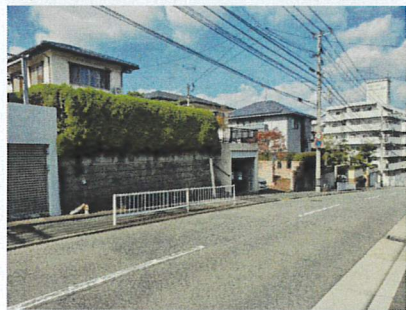
若宮多田羅2号線に接道