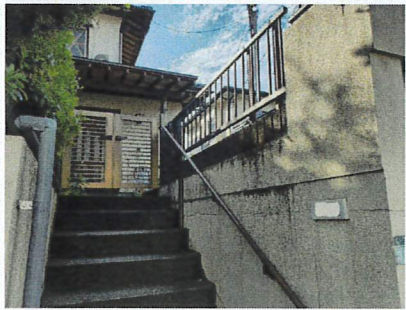
道路より高低差有ります