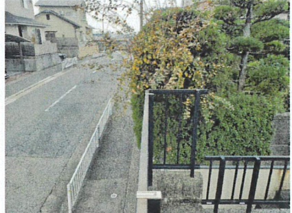
道路より高低差有ります